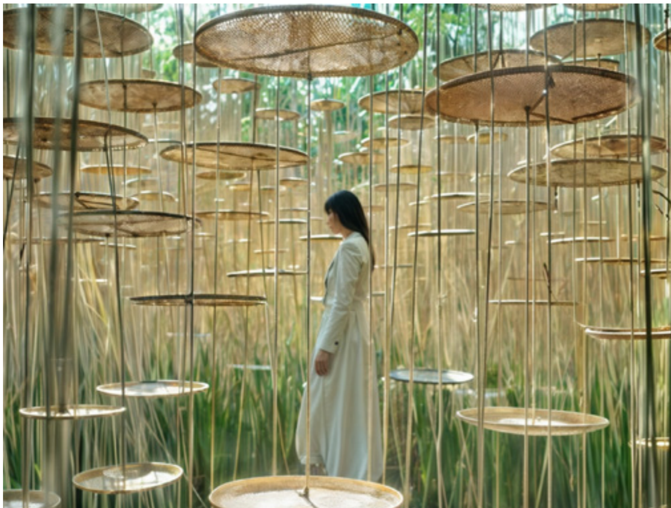
Wujiang East Lake Tai Ecological Tourism Resort, International Competition, 2015

Οι σχεδιαστικές μας λύσεις δημιουργούνται μεθοδικά μετά από αυστηρή ανάλυση του Τόπου. Θεωρούμε τα περιβαλλοντικά ζητήματα, την επανάχρηση των φυσικών πόρων , την οικονομική βιωσιμότητα, την κοινωνική ευθύνη και την καλή χειροτεχνία ως βασικά χαρακτηριστικά της δουλειάς μας. Αυτό το ήθος είναι θεμελιώδες για όλα τα έργα μας, από τον προγραμματισμό έως την κατασκευή.